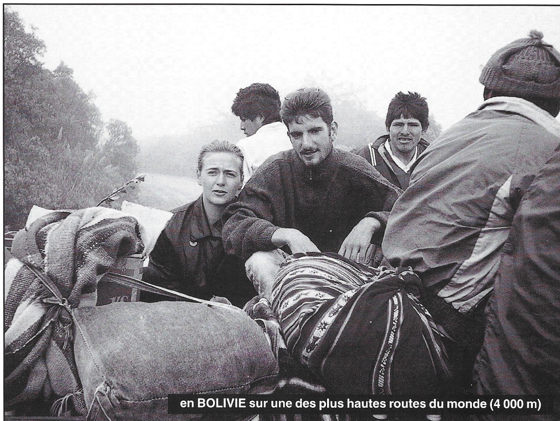
en BOLIVIE sur une des plus hautes routes du monde (4 000 m)

Les 4 mois de traitement me renforcent dans mon envie de voyages et d'aventures nouvelles. Dès ma guérison, je pars en Irlande pour 3 semaines d'auto-stop et de nuits sous la tente. De passage à Dublin, une idée me séduit : démarrer de zéro dans une ville inconnue, y apprendre un métier et s'y installer. Je tape aux portes. La première s'avère être la bonne, je suis embauché comme barman cuisinier. Sans aucune expérience, les débuts en cuisine sont difficiles et la solitude pesante, mais j'aime le sentiment de devoir se faire une place